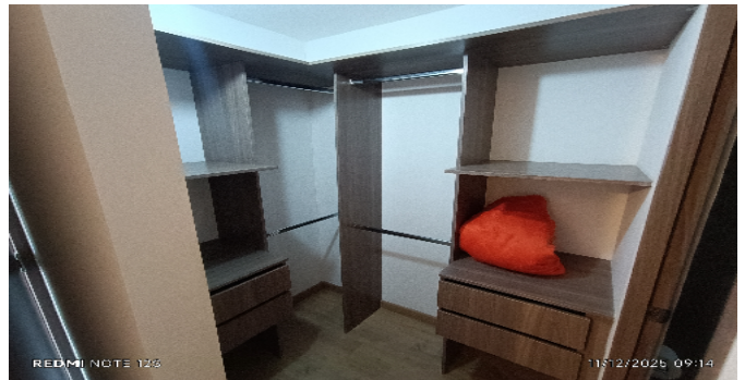
Closet hab. 3