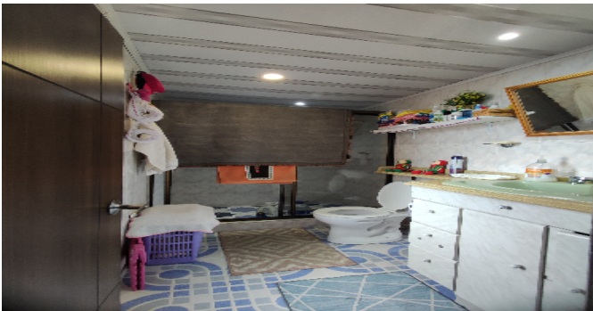
Baño Privado Hab 2