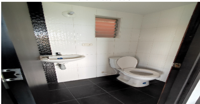
Baño Privado Hab 3