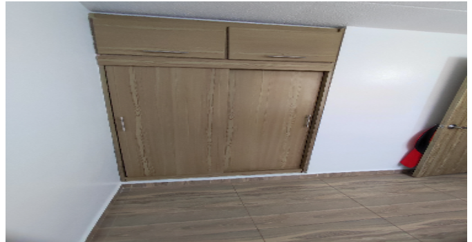
Closet hab. 2