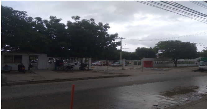
Fachada del Conjunto