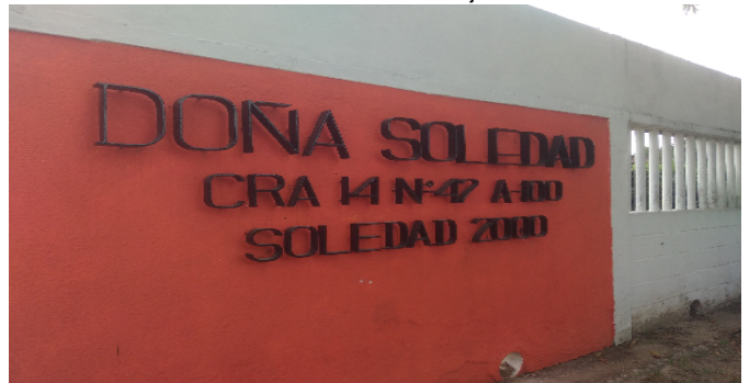
Nomenclatura del Conjunto