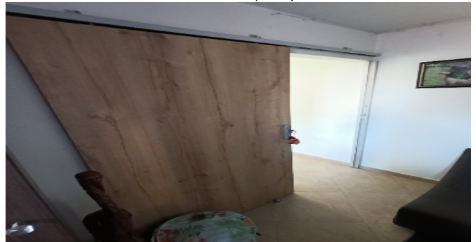
Puerta Hab. principal