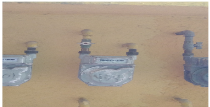
Contador de Gas