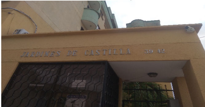
Nomenclatura del Conjunto