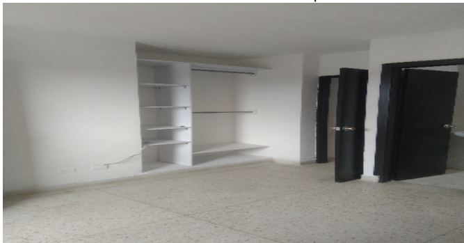
Hab. 1 o Habitación Principal