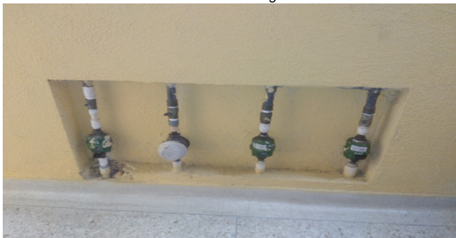
Contador de Agua