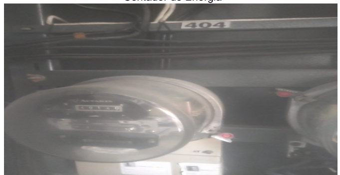
Contador de Energia