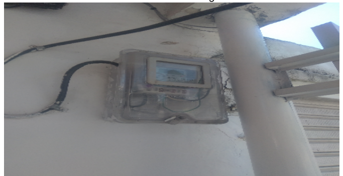
Contador de Energia