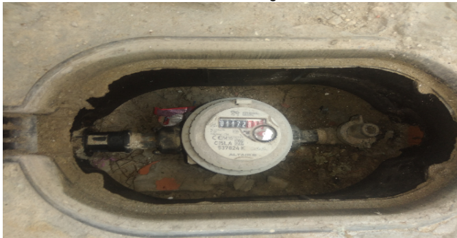
Contador de Agua