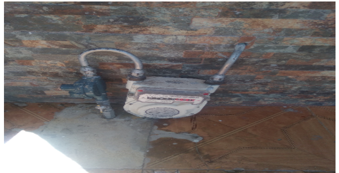
Contador de Gas