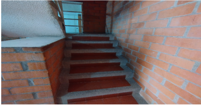
Escalera del inmueble