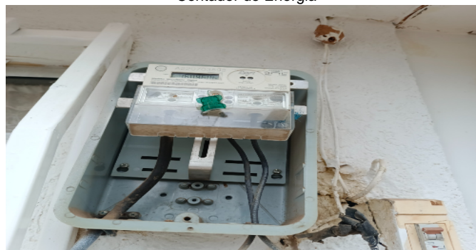
Contador de Energia