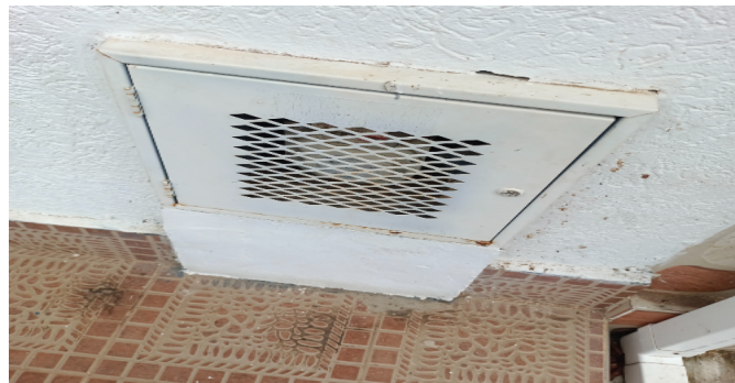
Contador de Gas