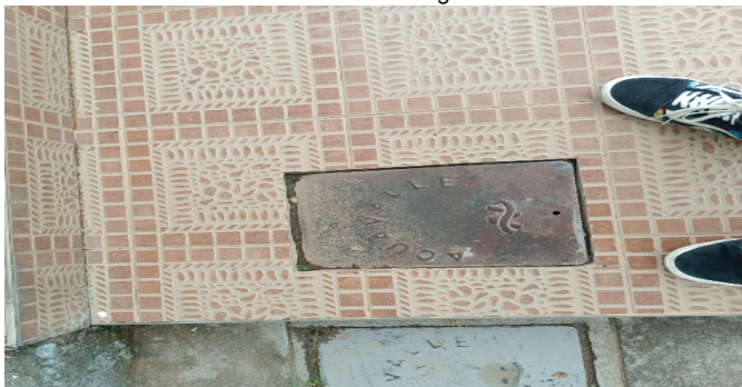
Contador de Agua