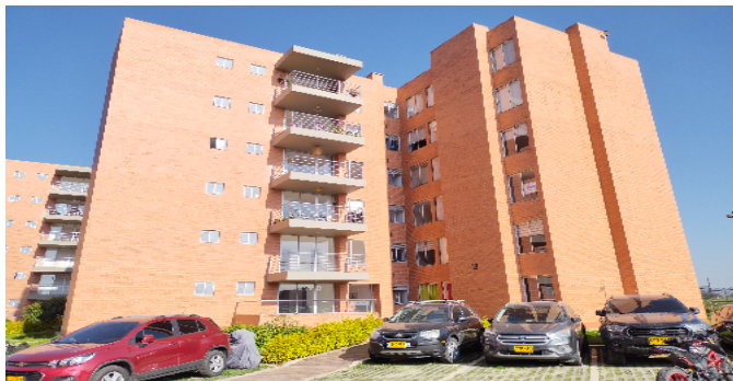
Fachada de la torre