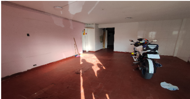
AP. 1 P1. GARAJE