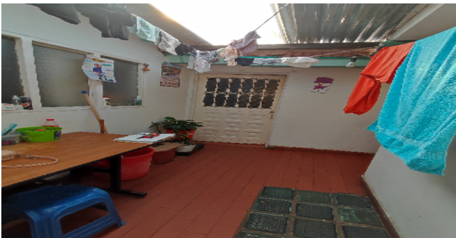
AP. 5 P3. ZONA DE ROPAS