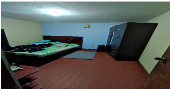
AP. 3 P2. HABITACION