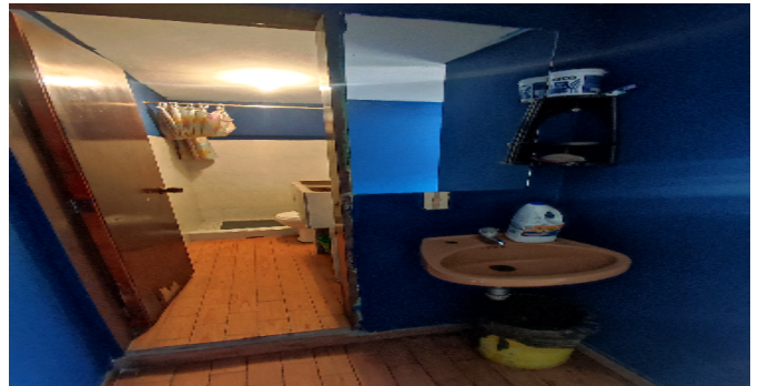
AP. 2 P2. BAÑO SOCIAL