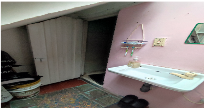
AP. 3 P2. BAÑO SOCIAL