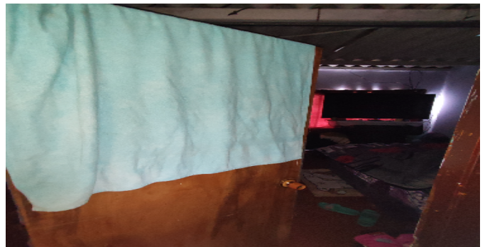
AP. 4 P3. HABITACIÓN