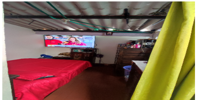
AP. 5 P3. HABITACIÓN