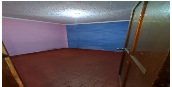
AP. 1 P1. HABITACIÓN