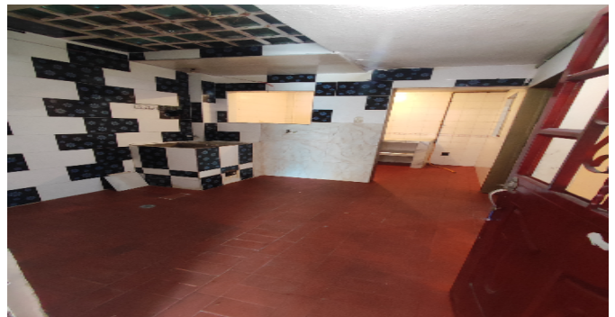
AP. 1 P1. COMEDOR