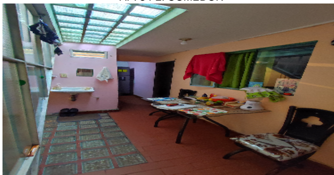
AP. 3 P2. COMEDOR