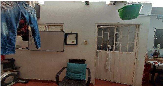
AP. 5 P3. PUERTA DE ENTRADA