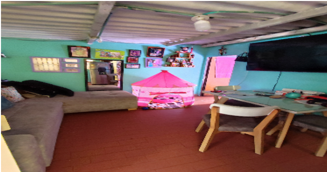
AP. 4 P3. SALA COMEDOR