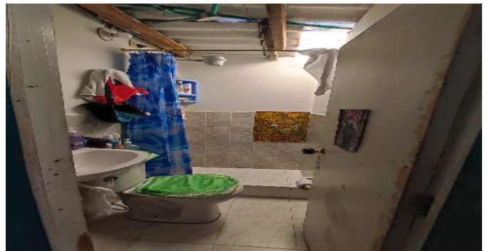
AP. 4 P3. BAÑO SOCIAL