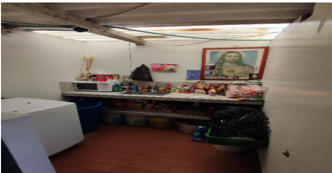
AP. 4 P3. COCINA