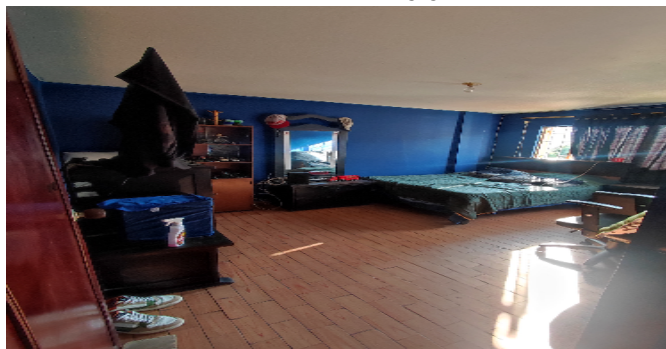
AP. 2 P2. HABITACIÓN