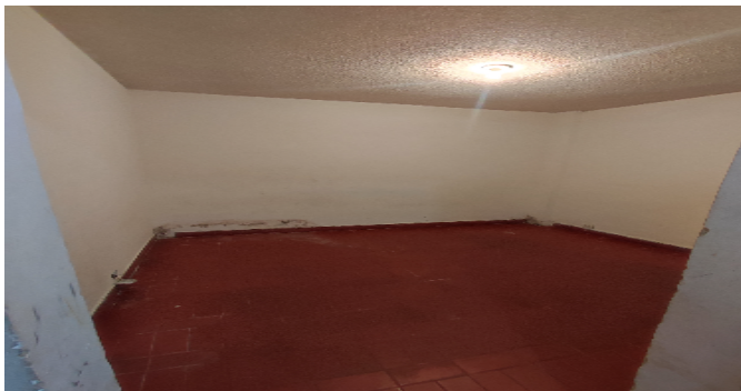
AP. 1 P1. HABITACIÓN