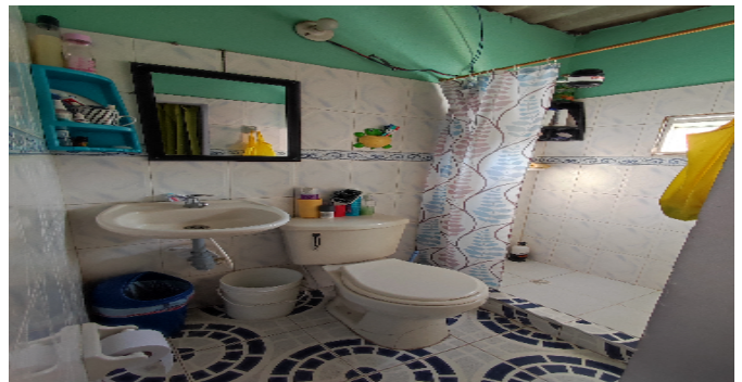
AP. 5 P3. BAÑO SOCIAL