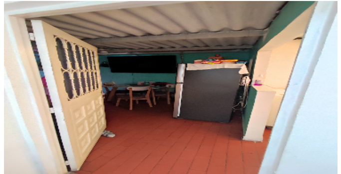
AP. 4 P3. PUERTA DE ENTRADA