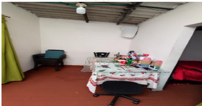
AP. 5 P3. COMEDOR