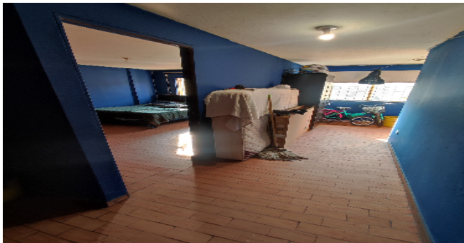
AP. 2 P2. ESTAR