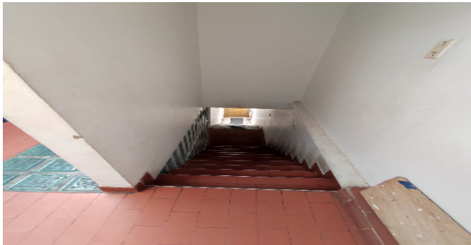
Escalera del inmueble