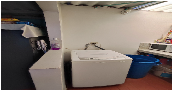
AP. 4 P3. ZONA DE ROPAS