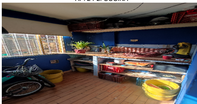
AP. 2 P2. COCINA