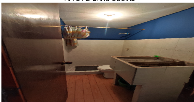
AP. 2 P2. BAÑO SOCIAL