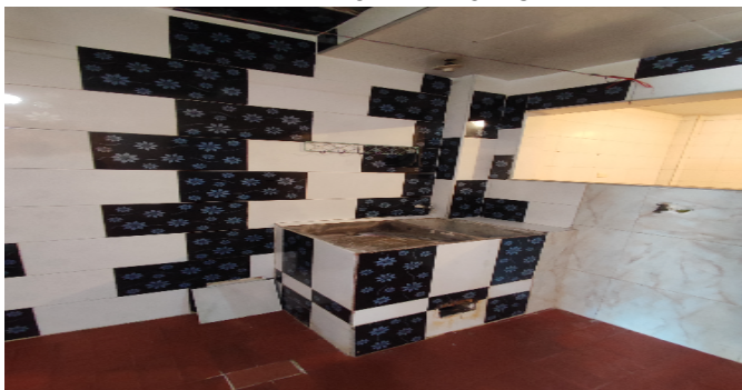
AP. 1 P1. ZONA DE ROPAS