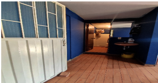
AP. 2 P2. PUERTA DE ENTRADA