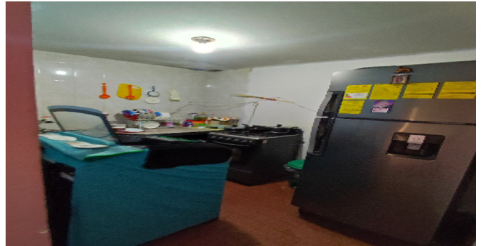
AP. 3 P2. COCINA