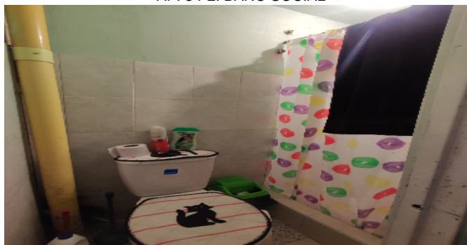
AP. 3 P2. BAÑO SOCIAL