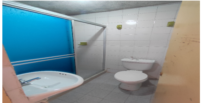
AP. 1 P1. BAÑO SOCIAL