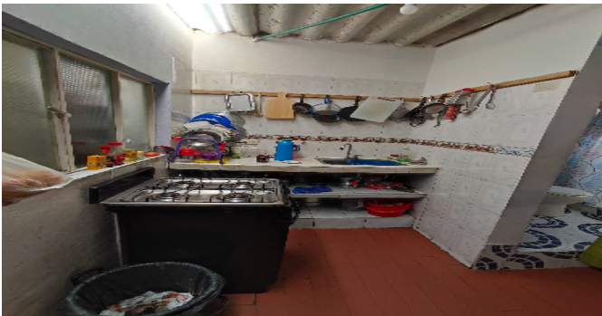
AP. 5 P3. COCINA