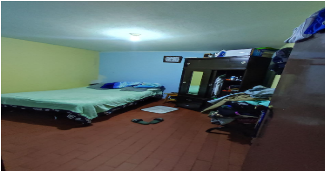
AP. 3 P2. HABITACIÓN