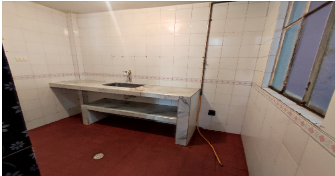
AP. 1 P1. COCINA