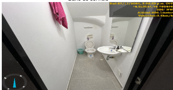
Baño de servicio