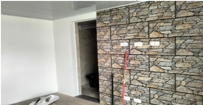
Hab. 1 o Habitación Principal