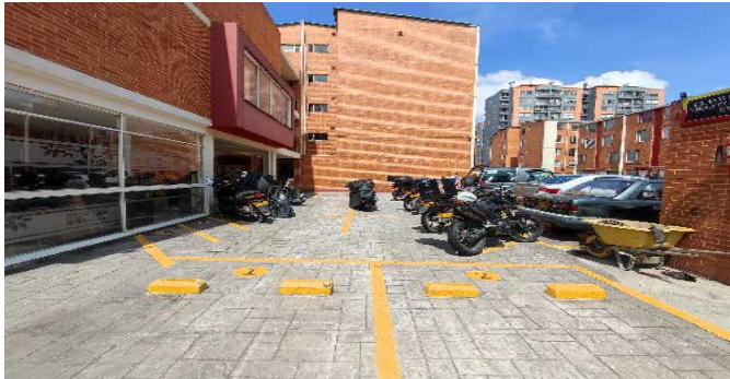
Garajes para motos-CJ