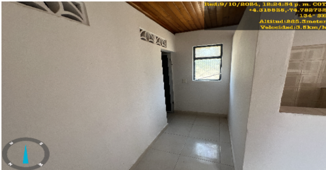
Hall o Estar de Habitaciones