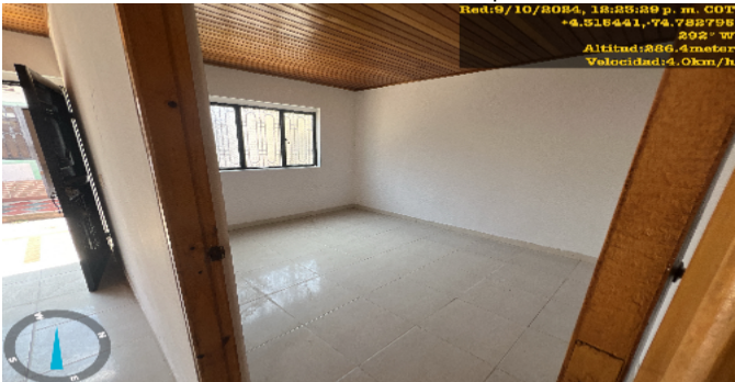
Hab. 1 o Habitación Principal