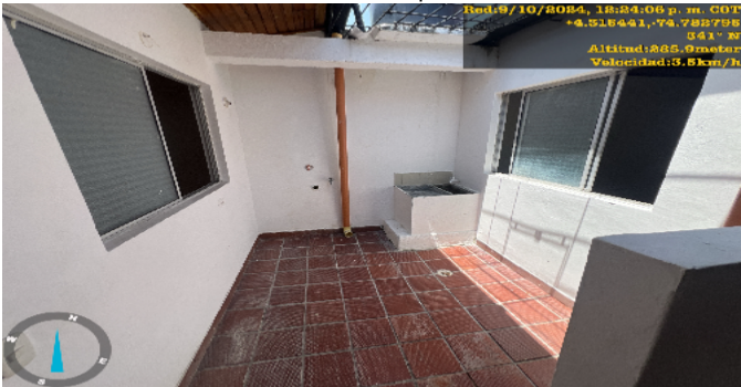
Zona de Ropas