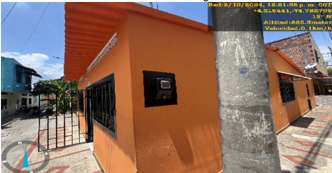
Contador de Energia