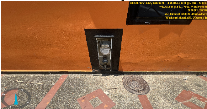
Contador de Agua