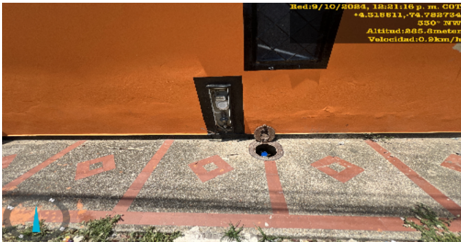
Contador de Gas