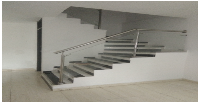
Escalera del inmueble