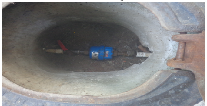
Contador de Agua