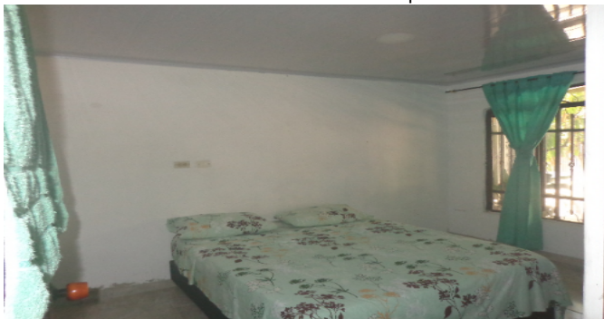
Hab. 1 o Habitación Principal