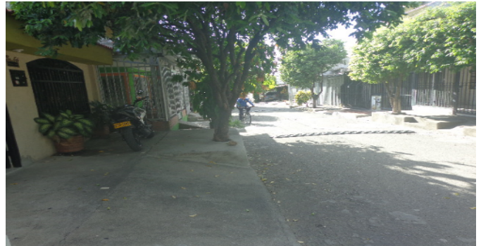
Vía frente al inmueble