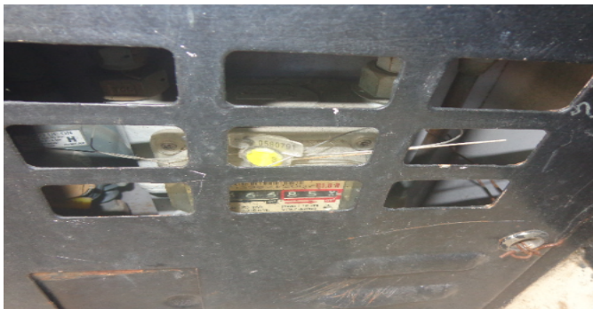
Contador de Gas