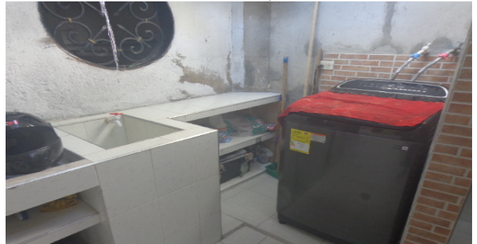
Zona de Ropas