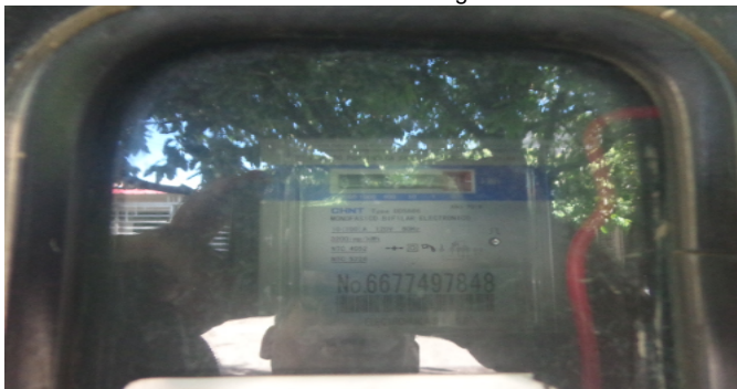
Contador de Energia