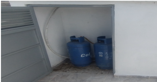
CILINDROS DE GAS