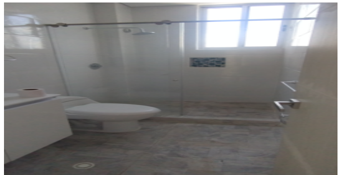
Baño Social 3