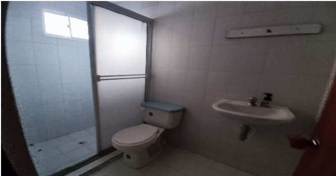
Baño Social 1