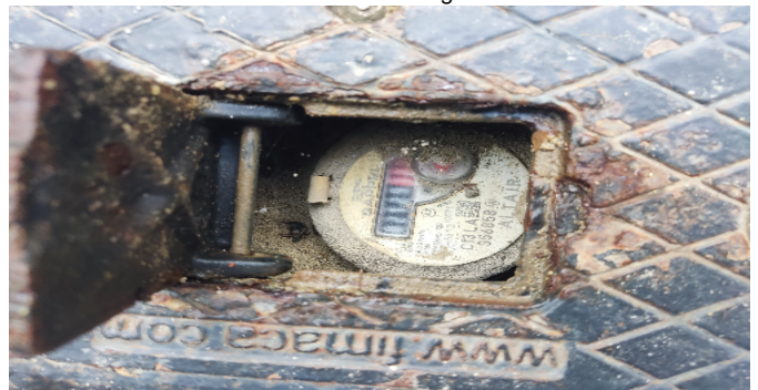
Contador de Agua