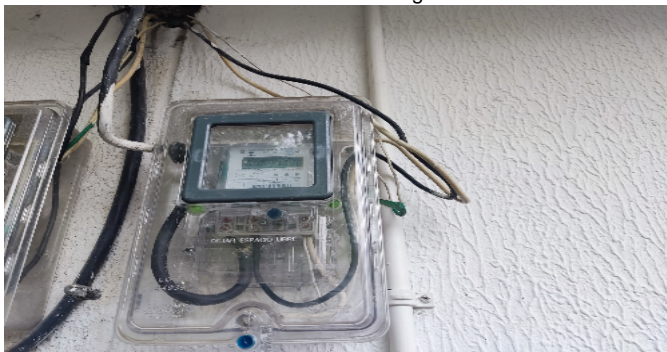
Contador de Energia