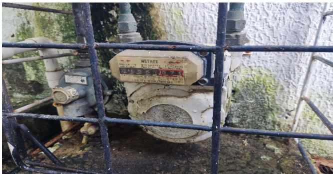
Contador de Gas