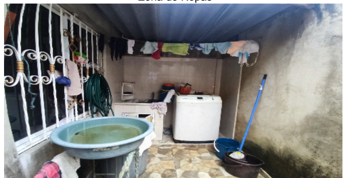
Zona de Ropas