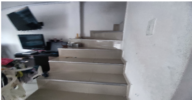
Escalera del inmueble