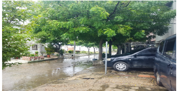
Vía frente al inmueble