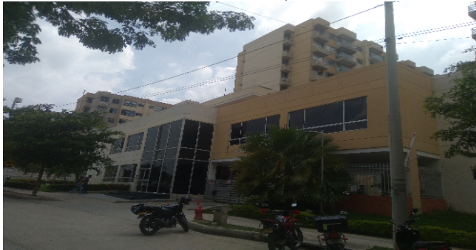
Fachada del Conjunto