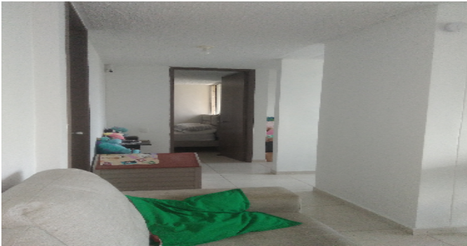
Hall o Estar de Habitaciones