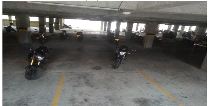
Garajes para motos-CJ