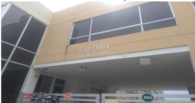
Nomenclatura del Conjunto