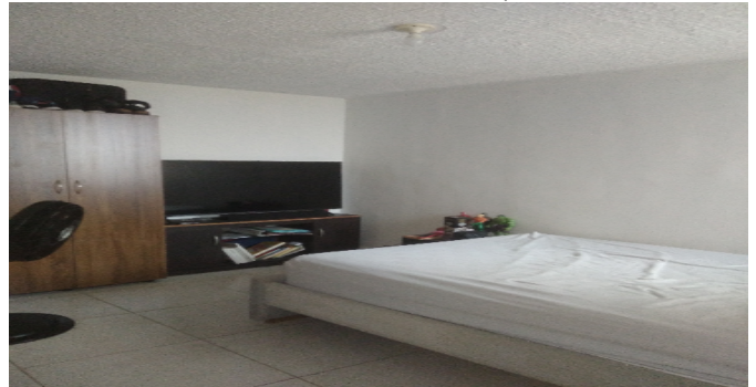
Hab. 1 o Habitación Principal