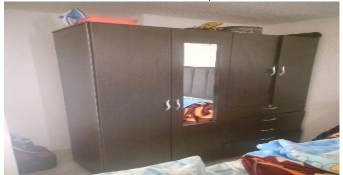
Closet hab. Principal