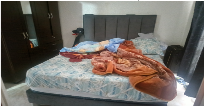
Hab. 1 o Habitación Principal