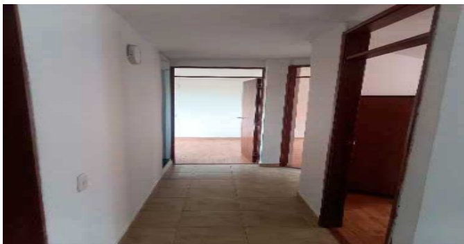
Hall o Estar de Habitaciones