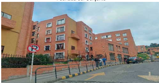
Fachada del Conjunto