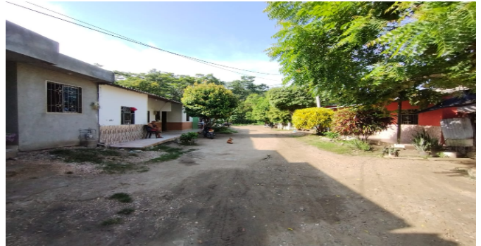
Vía frente al inmueble