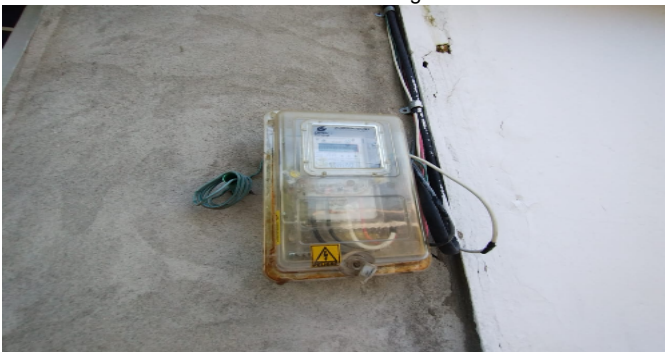
Contador de Energia