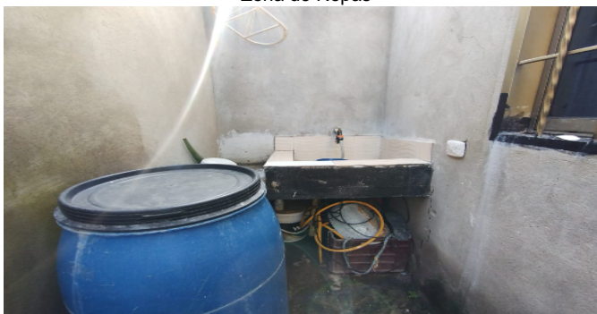
Zona de Ropas