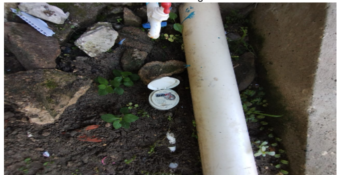
Contador de Agua