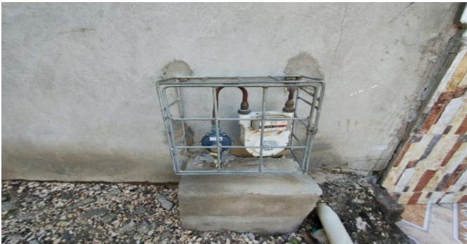
Contador de Gas