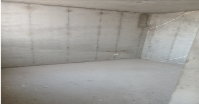
Hab. 1 o Habitación Principal