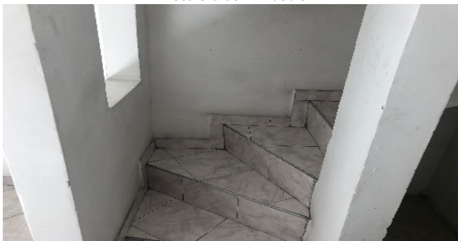
Escalera del inmueble