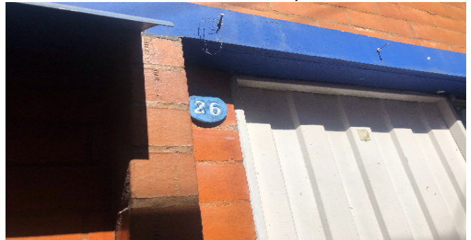
Nomenclatura del Conjunto