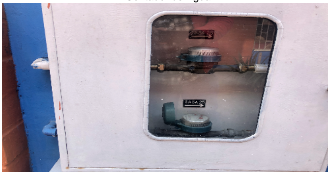
Contador de Agua