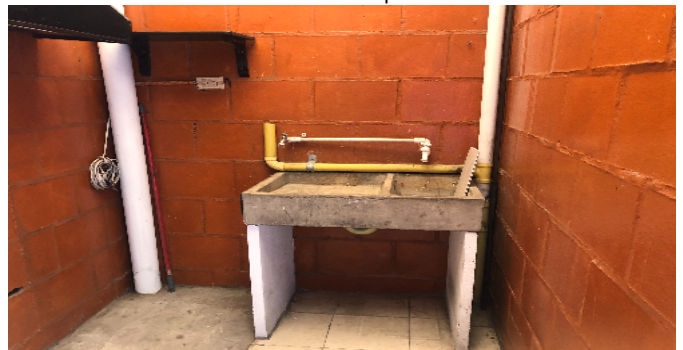
Zona de Ropas