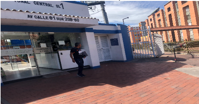
Fachada del Conjunto