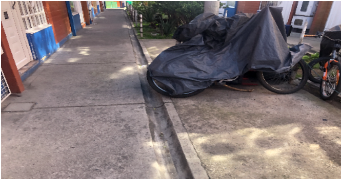
Vista Inmueble Contiguo