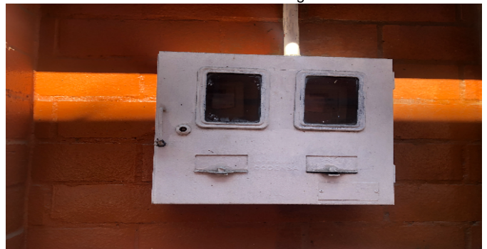
Contador de Energia