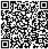
QR validez del avalúo