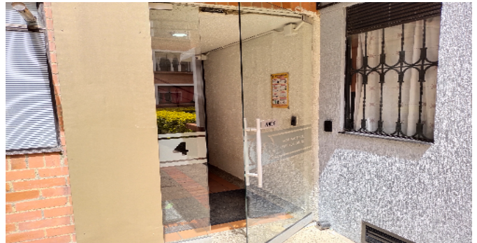
Entrada a la torre