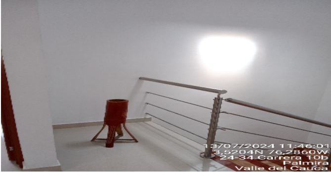
Escalera del inmueble