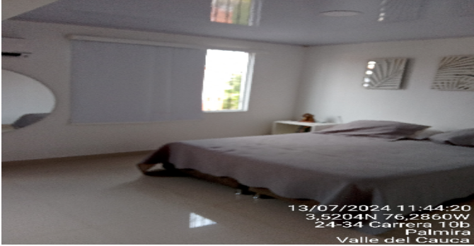
Hab. 1 o Habitación Principal