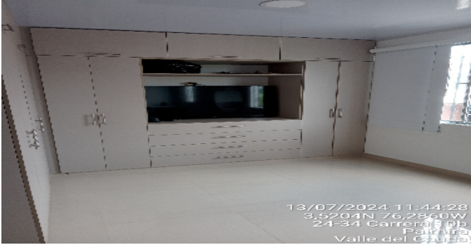
Closet hab. Principal