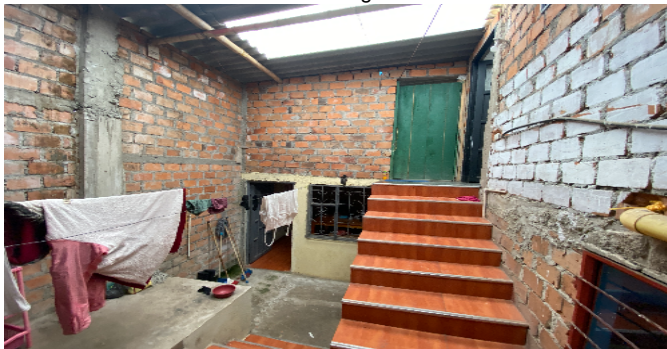
Escaleras a Segundo Piso