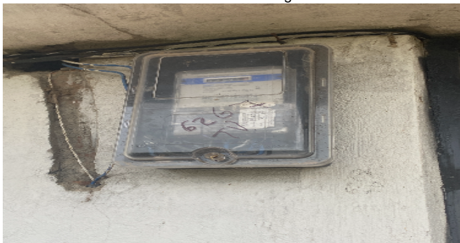
Contador de Energia