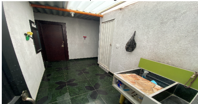
Zona de ropas - Segundo Piso