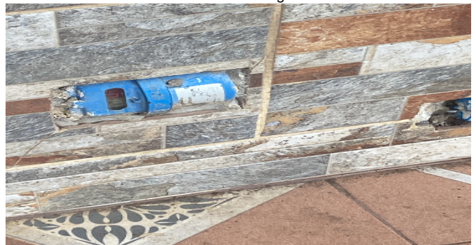
Contador de Agua