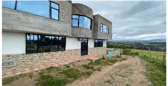
Vía frente al inmueble