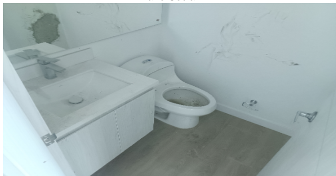
Baño Social 2