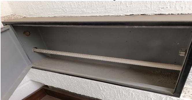
Contador de Agua