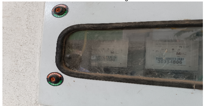
Contador de Energia