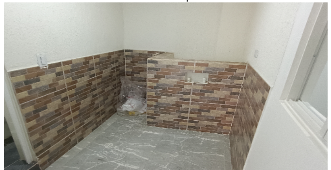
Zona de Ropas