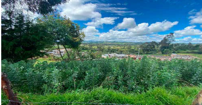
Sector Sur vista sentido occidente