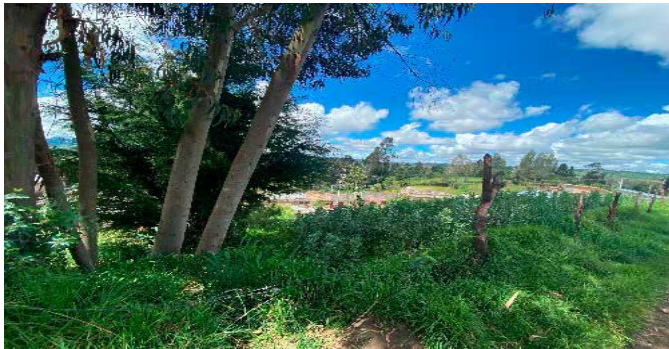
Lindero Sur vista sentido occidente