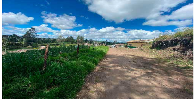
Lindero oriente hacia camino veredal