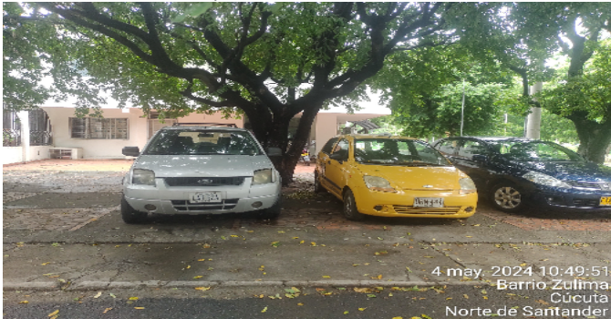
Parqueaderos visitantes carros