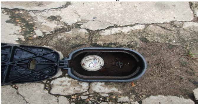
Contador de Agua