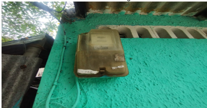
Contador de Energia