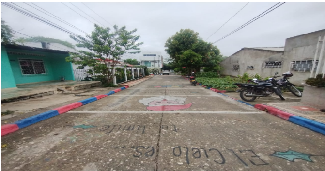
Vía frente al inmueble