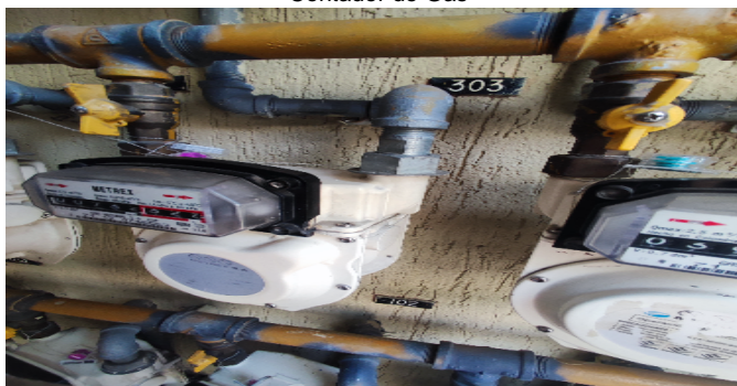
Contador de Gas