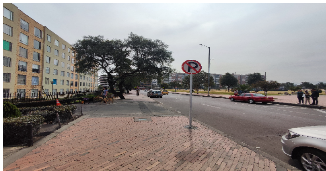
Vía frente al inmueble