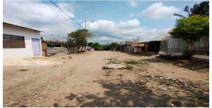
Vía frente al inmueble