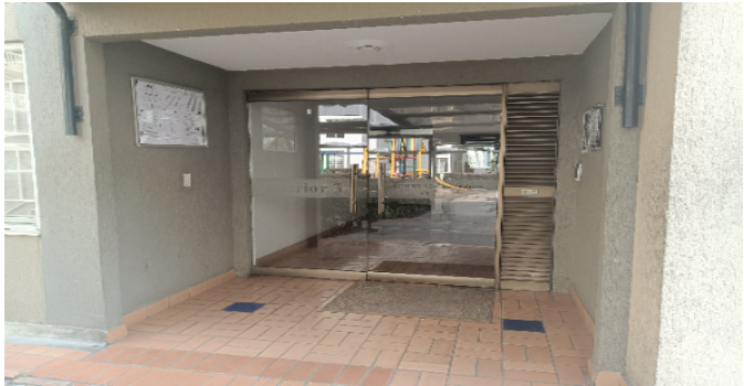
Puerta acceso Torre 3