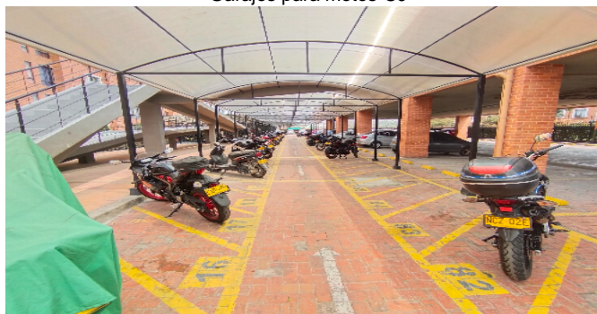
Garajes para motos-CJ