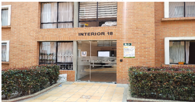
Entrada a la torre