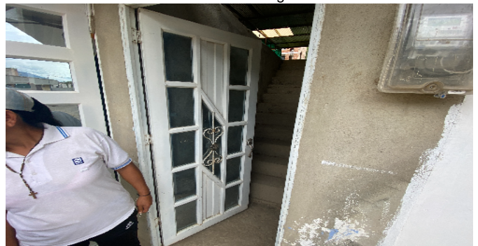
Puerta de Entrada Segundo Piso