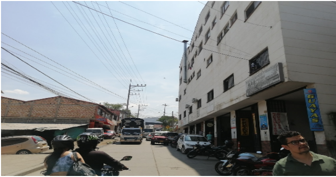
Entorno - Transversal 21