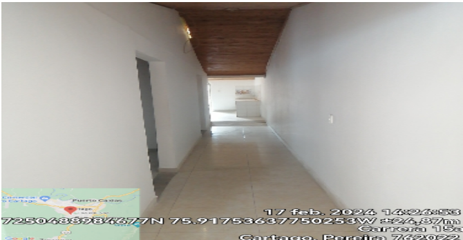
Hall o Estar de Habitaciones