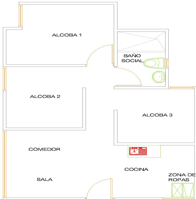
APARTAMENTO 502 - TORRE 3