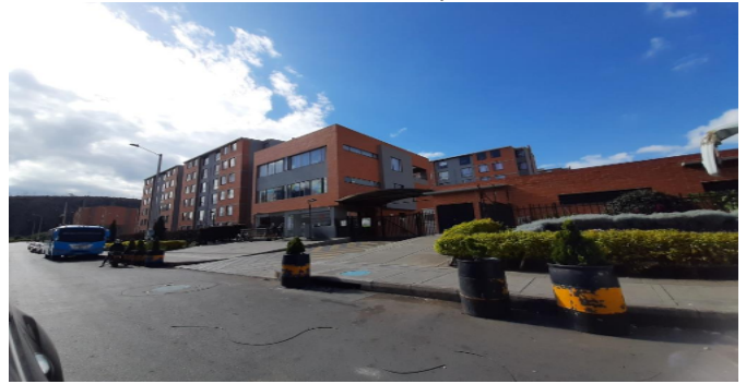
Fachada del Conjunto