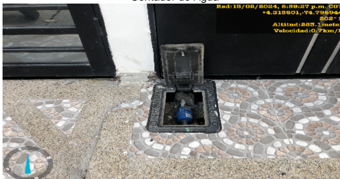
Contador de Agua