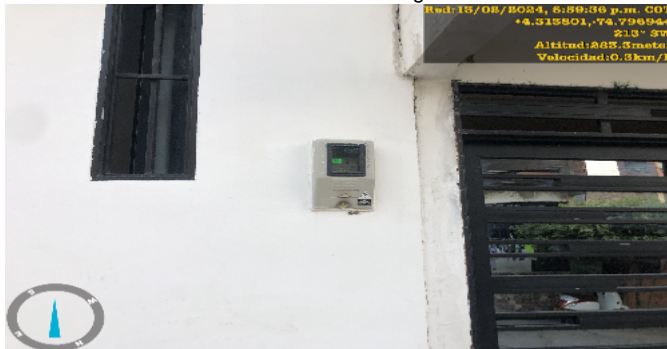
Contador de Energia