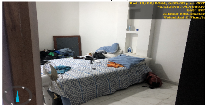
Puerta Hab. principal