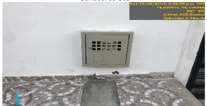
Contador de Gas