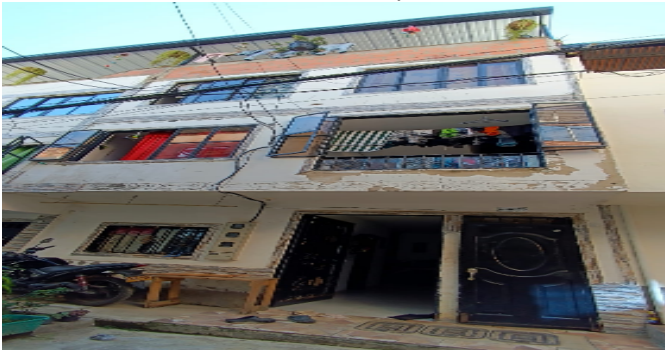
Fachada del Conjunto