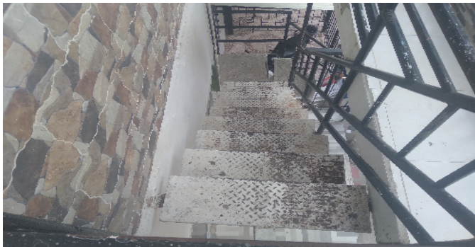
Escalera común - CJ