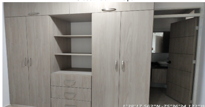
Closet hab. Principal