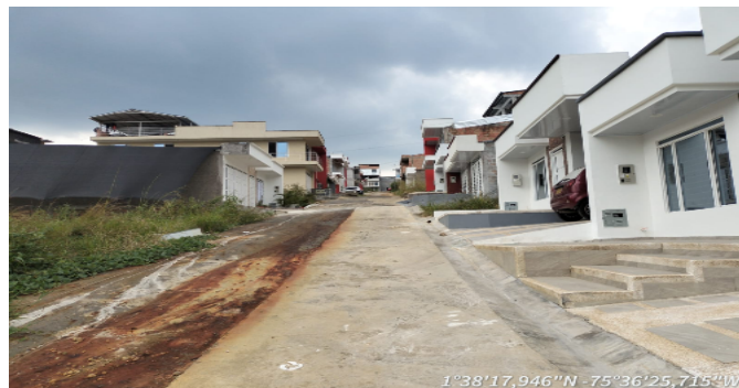
Vía frente al inmueble