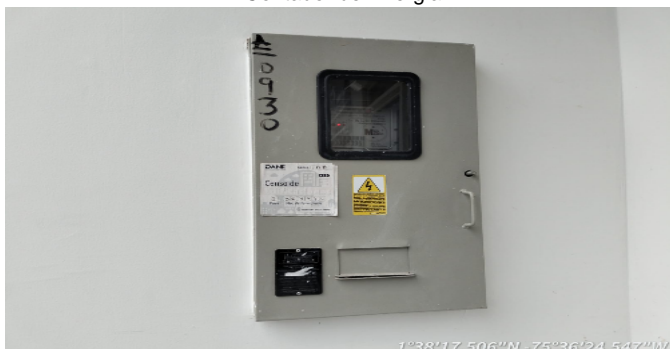
Contador de Energia