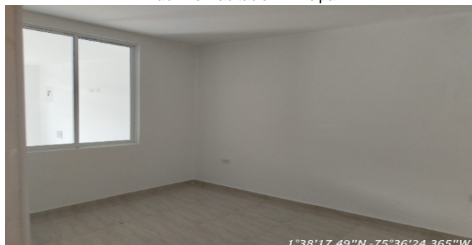
Hab. 1 o Habitación Principal