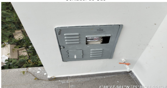
Contador de Gas