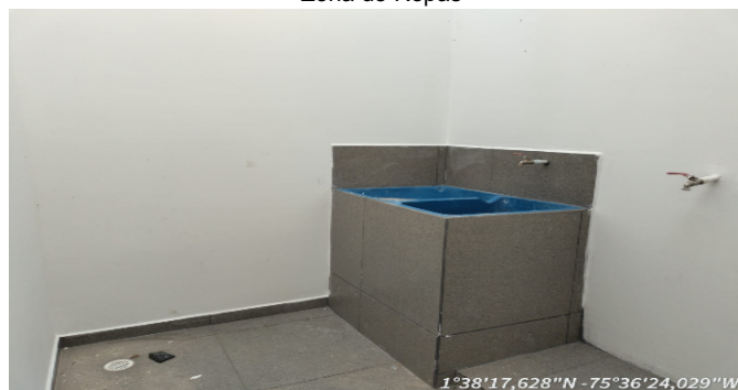
Zona de Ropas