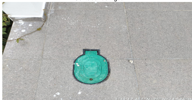
Contador de Agua