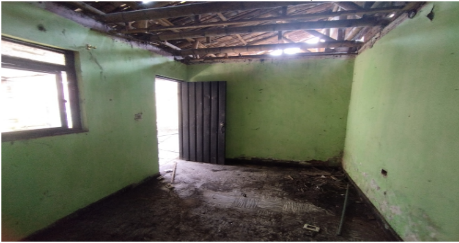
Hab. 1 o Habitación Principal