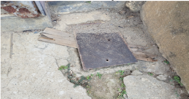
Contador de Agua