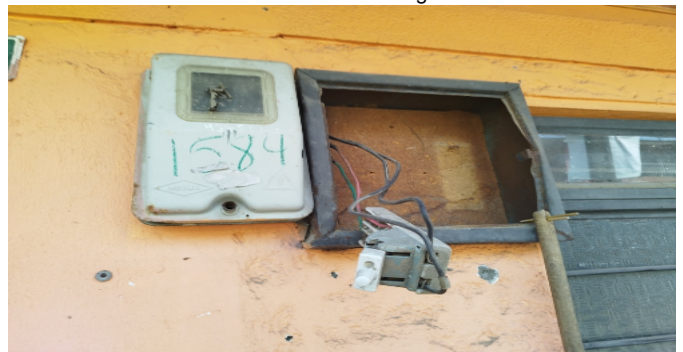
Contador de Energia