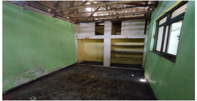
Closet hab. Principal