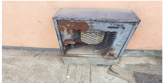
Contador de Gas