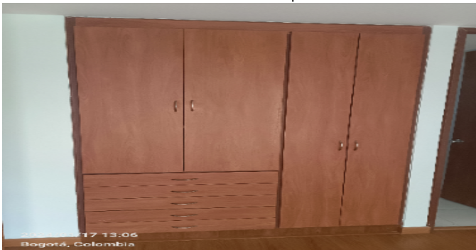
Closet hab. Principal